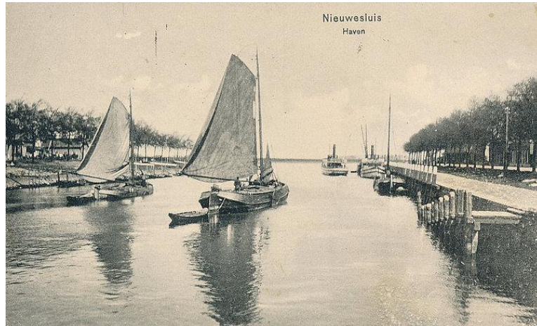
Het in middels verdwenen plaatsje Nieuwesluis, bij Heenvliet, was het beoogde overstappunt van de geplande nieuwe stoombootdienst.