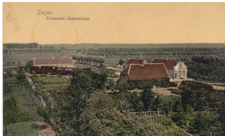
Stoomtram in de Achterstraat, Strijen, 1912 .

Dit kwam o.m. tot uiting in bij deze bespreking naar voren gebrachte cijfers omtrent het vervoer van bodemproducten. In 1931 reden ongeveer 5000 wagens met groenten; uit de richting Strijen kwamen alleen reeds 100.000 kisten groenten, met een opbrengst van f 205.307 . De groenten, door de R.T.M. uit de richting Numansdorp aangebracht, brachten f 129.345 op. De opbrengst van het vervoer van tuinbouwproducten door de R.T.M. beliep pl.m. f 40.000 , de tarieven voor dat vervoer werden niet te hoog geacht.