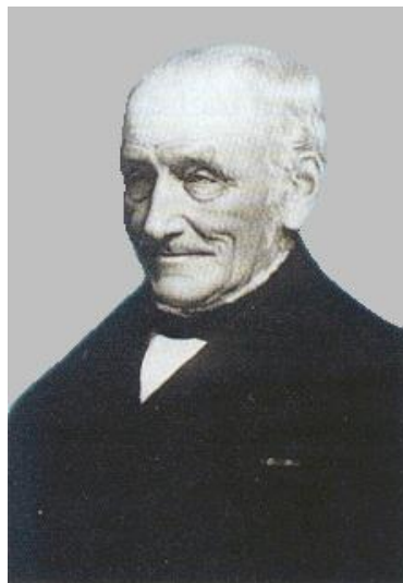
De heer Fop Smit (11 oct. 1777 – 25 aug. 1866), grondlegger van een groot scheepvaart consortium waarvan delen nog altijd succesvol actief zijn, op het gebied van o.a. sleepvaart, berging, hijsvaartuigen en diverse havenactiviteiten.

- Wat het artikel ook inzichtelijk maakt, is dat de RTM vrijwel letterlijk vanuit alle hoeken werd geschopt en geslagen; niet alleen door gemeenten, de schrijvende pers en klagende reizigers, maar ook door het rijk, concurrenten, de aandeelhouders, obligatiehouders (en zelfs het eigen personeel). Ir. Kuiper, moest behoorlijk van zich afbijten om de RTM overeind en gaande te houden. Later zouden de opkomst van het wegverkeer, de Tweede Wereldoorlog, de Watersnoodramp en een vijandige aandelenaankoop, het vervoersbedrijf tot het uiterste tergen. Maar de tram bleef altijd rijden en het veer bleef altijd varen, onder alle omstandigheden. Maar de erg hoge prijs, werd betaald door de directie en het personeel.