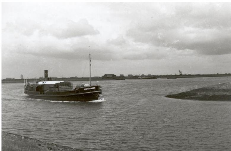
Kort na WO2 waren materialen schaars (en duur); de ss Grevelingen (A) werd opgebouwd uit drie geborgen scheepswrakken .