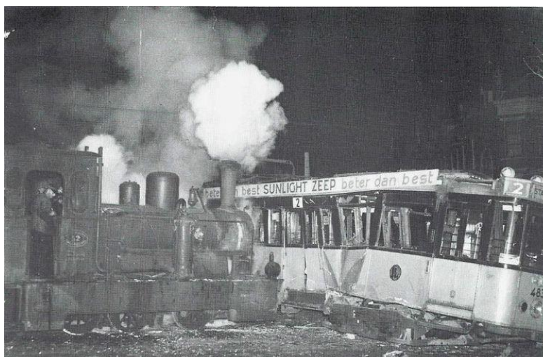
Het oversteken va de Oranjeboomstraat lukte niet altijd zonder slag of stoot. RET-motorrijtuig 483 verleende geen voorrang, en werd vervolgens stevig geraakt door RTM-loc 52 .