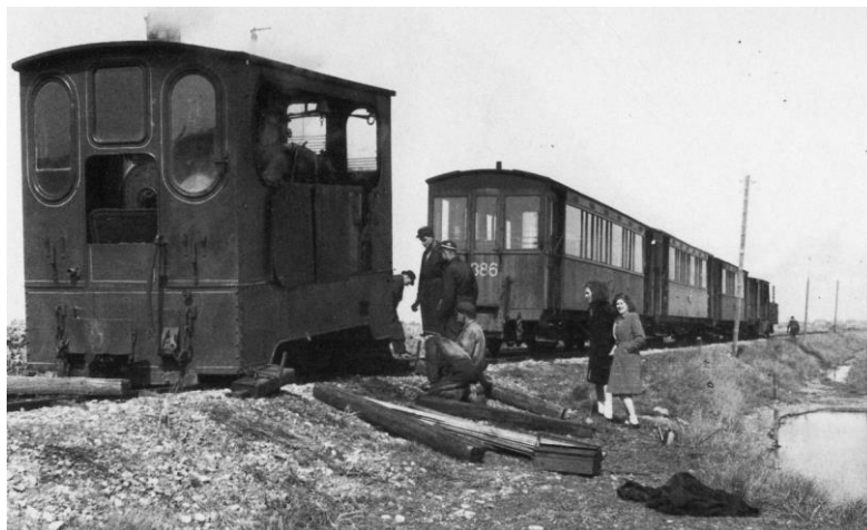
Loc 33, gederaillerd te Brouwershaven.