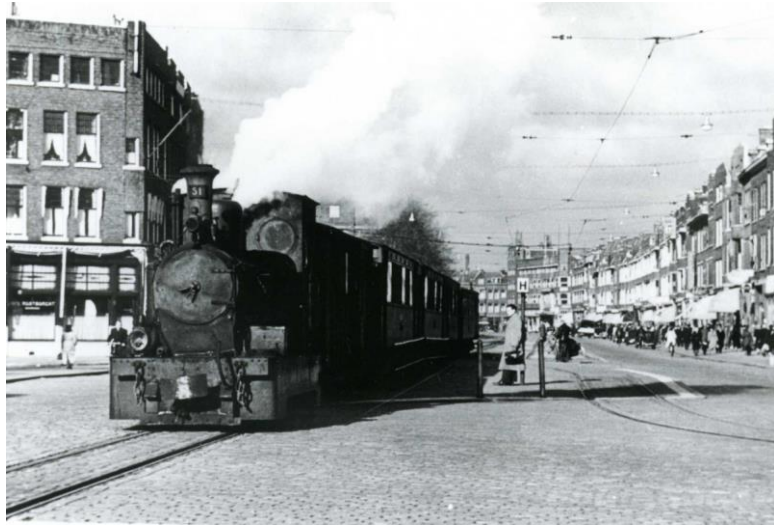
Loc 51 rijdt met tram vanaf de Beijerlandselaan de Groene Hilledijk op, richting Hoeksche Waard. Circa 1950 . Gebouwd in 1916, midden in de Eerste Wereldoorlog.