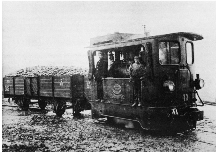
Loc 43 (ex-RTM 14 (A)) te Zierikzee-Sas. Naast de machinist een jong stokertje.