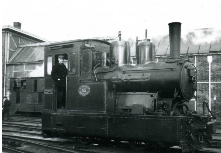
Twee-assige -loc 45 (B), ex-EDS 103, op het Handelsterrein. Linksachter staat loc 16, december 1947.