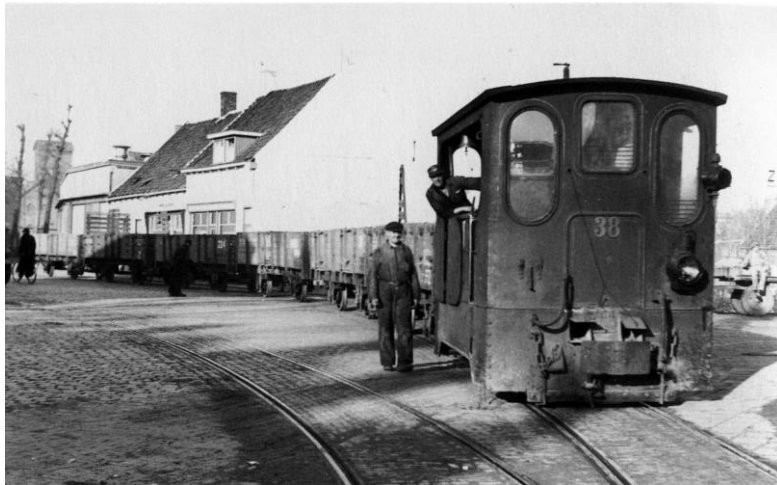
Loc 38 met lege bakwagens te Steenbergen.