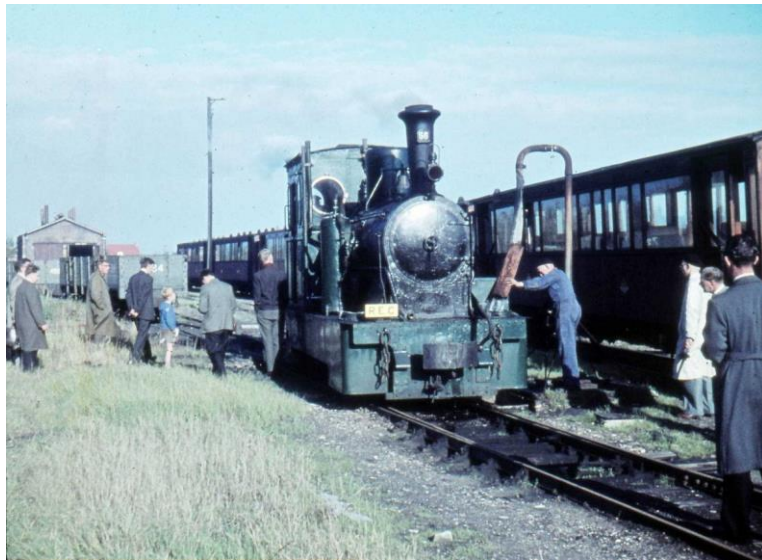
Loc 56 neemt, onder grote belangstelling van vele geïnteresseerden, water te Oostvoorne, tijdens de stoomexcursie van 7 oktober 1961 .