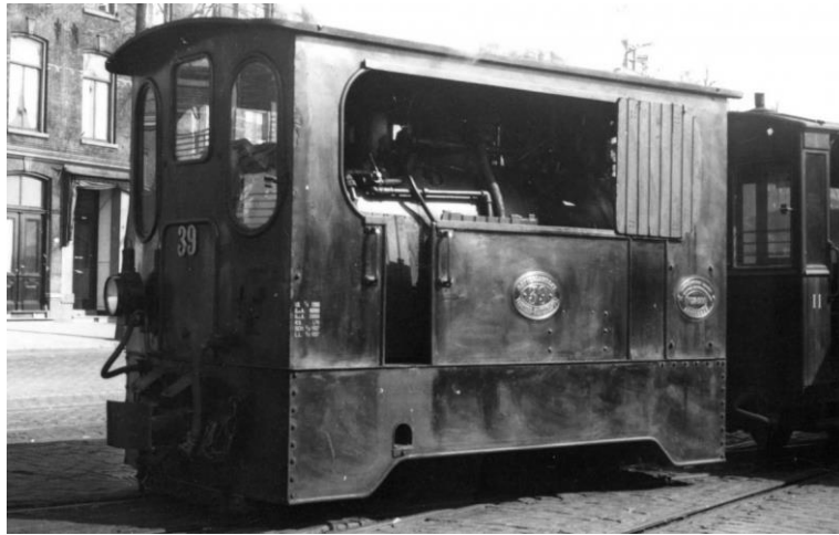
Loc 39, verlaat het Handelsterrein, Rotterdam, 2 maart 1940 .