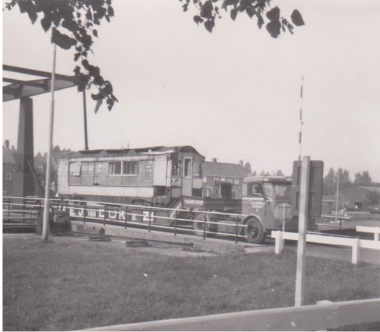
Op 22 augustus 1968 arriveerde rijtuig 388 bij het RTM-museum te Hellevoetsluis. Helaas werd besloten het rijtuig NIET te restaureren.