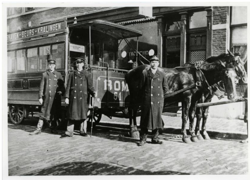
De bekendste Rotterdamse omnibuslijn was die van de ROM, van Delfshaven naar Kralingen. Omnibus 51 lijkt sterk op een paardentramrijtuig.