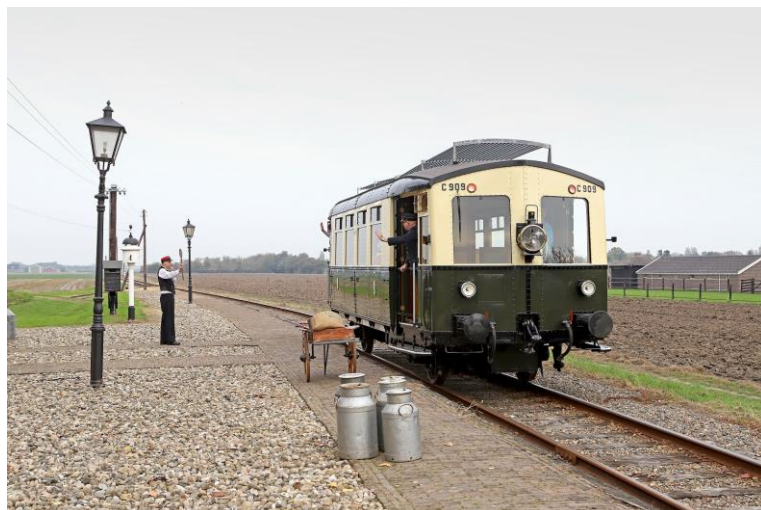
Proefrit replica omC 909 bij SHM, november 2018 .