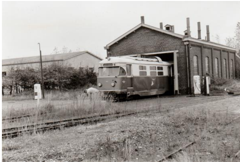
Oostvoorne, remise met MD 1806 'Bergeend'. 17 October 1966 .