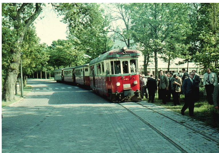
1804 met rijtuigen 1506, 1503, 1504, Oostvoorne, 18 mei 1959 .